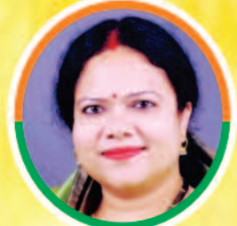
मा. पिकी पुरव