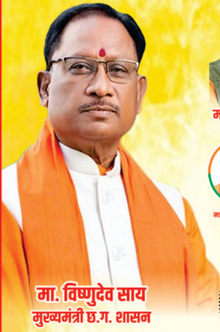
मा. विष्णुदेव साय मुख्यमंत्री छ.ग. शासन