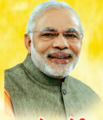
मा. नरेन्द्र मोदी