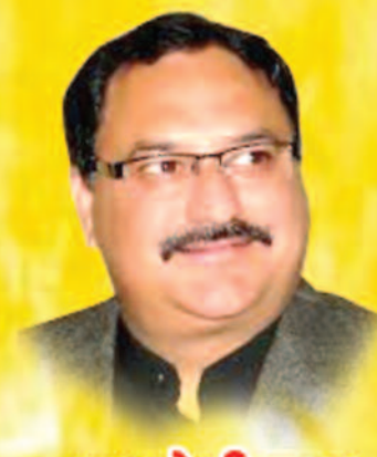
मा. जे.पी. नड्डा