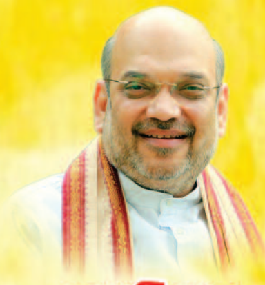
मा. अमित शाह